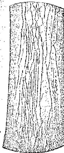
Рис. 2. Растрескивание нанесенного слоя смолы на резиновой трубке при ее расширении

Можно пренебречь действием приклеенного куска на деформацию полосы и считать, что перемещение ее точек при неподвижном начале координат направлено по оси x и представляется формулой: